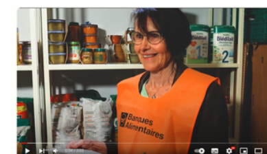
Centres sociaux et Espaces de la vie sociale de l'Aveyron - "Solidarité de proximité"