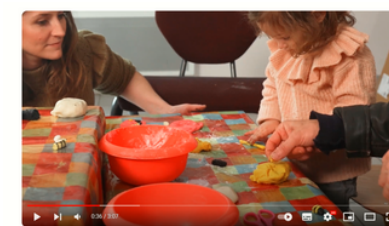
Centres sociaux et Espaces de la vie sociale de l'Aveyron - "Acteurs du territoire"

Au cœur des Centres Sociaux et des Espaces de la Vie Sociale de l'Aveyron, découvrez-les en images ! Une vidéo globale et 6 petits clips sur différentes thématiques. A découvrir ICI