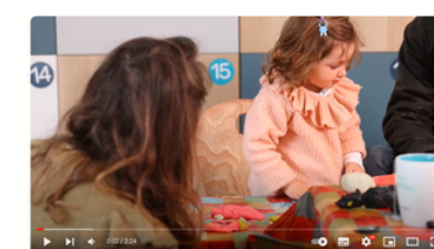
Centres sociaux et Espaces de la vie sociale de l'Aveyron - "Parentalité"