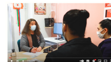
Centres sociaux et Espaces de la vie sociale de l'Aveyron - "Accès aux droits"